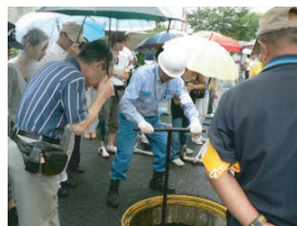
えだにししょうがっこう