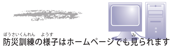
ぼうさいくんれん ようす 防災訓練の様子はホームページでも見られます

◆男性 (メキシコ出身) 救急対応の訓練を見ているとき、やさしい日本語で解説してもらったのでよくわかった。日本人と訓練に参加する経験がなかったので、非常時のことを考えるといい体験をした。