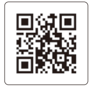
ラウンジ QR コード