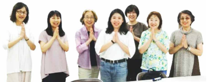
タイ文化研究会 メンバー

*マイペンライ(ไม่เป็นไร)とは 「大丈夫、問題ない、どういたしまして」など、幅広い意味で使われる、タイのおおらかな国民性を象徴する言葉