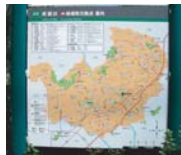
Impormasyon Kapulungan para sa mga kanilang ng ebakasyon