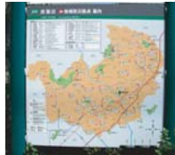
地域避難場所掲示板

すいどうお客様サービスセンター（日本語で） 水道局お客様サービスセンター（日本語で） みずとすいどうをつかい始める/使うのを止める ときや料金の問い合わせは、一年中いつでも受け付けます。 ☎ 045-847-6262